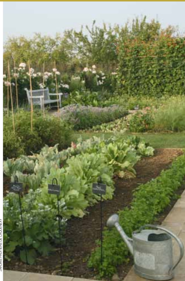
JARDINS FRUITIERS DE LAQUENEY

¿Qué pasa si solo dispones de un espacio orientado al norte o que recibe unas pocas horas de sol al día? En ese caso debes escoger especies que funcionen bien en semisombra. Las verduras de hojas verdes —lechuga, espinaca, rúcula, escarola— y hierbas culinarias como el perejil, cilantro, hierbabuena solo precisan entre tres y cuatro horas de sol al día (pág. 17); las coles en general, la coliflor y la berza, entre tres y cinco horas, y los guisantes, entre cuatro y cinco horas. Las fresas, frambuesas, arándanos, grosellas y moras se consideran prácticamente de sombra (págs. 20 y 21).